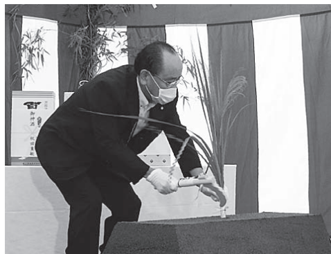
▲鍬入れする岩倉町長