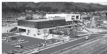
▲完成イメージ(一般道側から)

祈願祭終了後は、岩倉町長が「多くの関係者の方々のおかげで本日を迎えることができました。地元農林水産物や県特産品をこの施設で販売し、隣接する公園も一体的に整備する