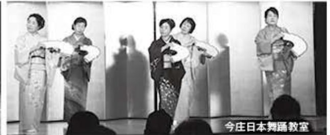
今庄日本舞踊教室