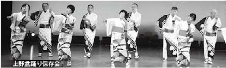
上野盆踊り保存会