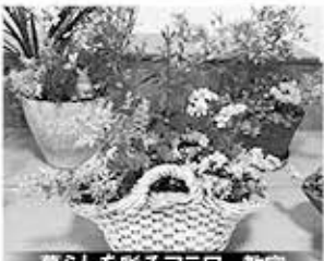
暮らしを彩るフラワー教室