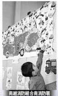
南越消防組合南消防署