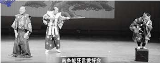
南条能狂言愛好会