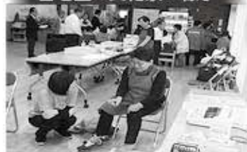
各地区の文化祭の様子

認知症について心配なことや、介護方法等について分からないことなどありましたら、各地区の地域包括支援センターまでご相談ください。