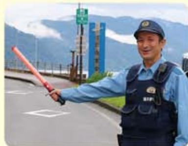
7月19日 甲楽城海水浴場前にて夏の交通安全県民運動一斉街頭指導

現在の趣味は、昨年初めてチャレンジしたマラソンで、普段は町内お気に入りのマラソンコースを見ながらトレーニングし、ハーフやフルマラソンなどにも挑戦中です。