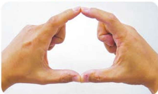
① 両手の親指と人差し指で輪っかを作ります。