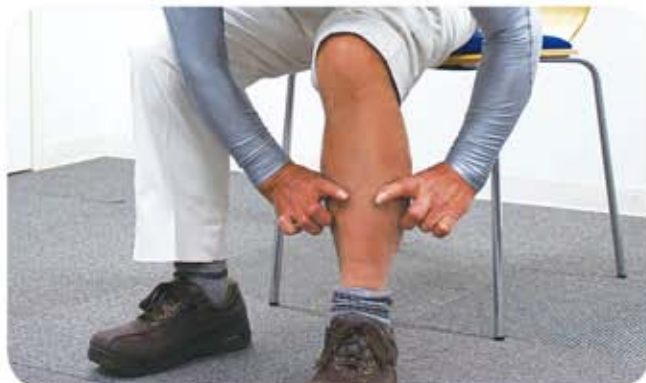
② 椅子に座り、利き足ではない方の膝の曲がり角を90度(直角)にします。ふくらはぎの一番太い部分を輪っかで軽く囲んでみます。

サルコペニアの危険度の高まりとともに、様々なリスクが高まっていくことがわかってきています。