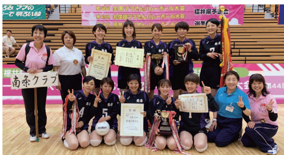
▲県予選会で優勝した南条クラブ(5月26日)

福井県予選で優勝した軟式野球チームの荒波とママさんバレーチームの南条クラブの激励会が6月20日行われ、各チームの代表者が役場を訪れました。