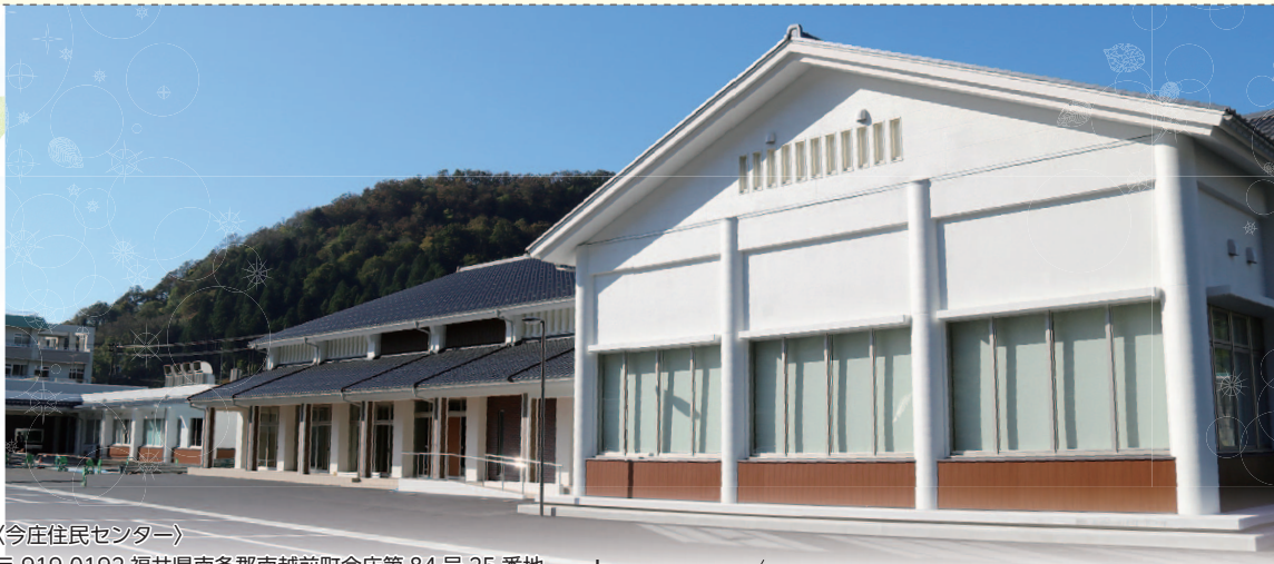
〈今庄住民センター〉 〒919-0192 福井県南条郡南越前町今庄第84号25番地