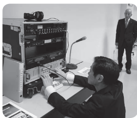
災害時に総務省北陸総合通信局から無償で貸与するコミュニティFM局の放送設備

昨年8月27日の県総合防災訓練において、北陸総合通信局が提案したラジオ生放送をNPO法人たんなん夢レディオが実施したのをきっかけに、12月1日、町とNPO法人たんなん夢レディオとの間で臨時災害放送局の開設に関する協定を締結しました。