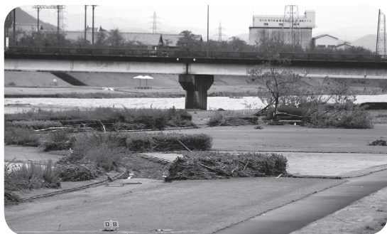
日野川の氾濫、倒木、歩道崩壊があったレインボーパーク南条

昨年10月22日未明に当町を襲った台風21号は、観測史上初の最大風速36.8mを記録し、2日間の降水量は253mmに達しました。河川の氾濫や倒木など被害総額は、8億円を超えています。そんな中、建設重機を有する建設業4社がボランティアで被害のあった町内公共施設の早期復旧実現に尽力くださいました。