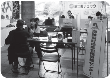
10/29 南条地区文化祭の様子

認知症について心配なことや、介護方法等について分からないことがあれば気軽に各地区の地域包括支援センターまでご相談ください。また 12 月には男性介護者を対象とした「認知症介護者のつどい」もありますので、是非ご参加ください。