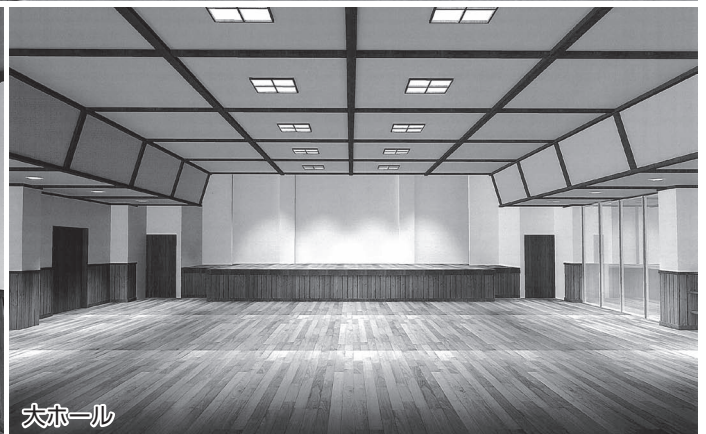
今庄保健センター改修部分 ←