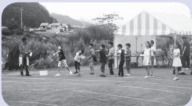
▲紙ひこうき飛ばしの様子