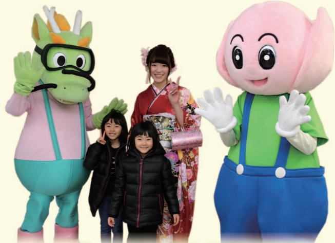
タッピーとはす坊とも記念に★

1月8日、南条文化会館で南越前町成人式が行われました。華やかな着物やスーツ姿の新成人は、級友や恩師らとの再会に喜色満面でした。 式典では、川野町長が「自立の精神を持って、自分の人生を歩んでいっていただき、ふるさとに自信と誇りを持ち、町をさらに盛り上げていただけることを願います。」と式辞。 132人の新成人の皆さんは、今日まで精一杯育ててくれた両親、温かく見守ってくださった地域の方々、教え導いてくださった先生方、苦楽を共にした友人の支えに感謝し、成人としての決意を新たにしました。