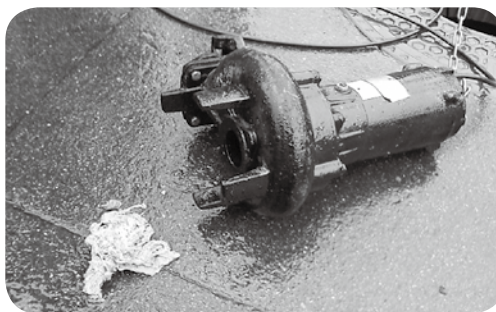
マンホールポンプ異物 衣類